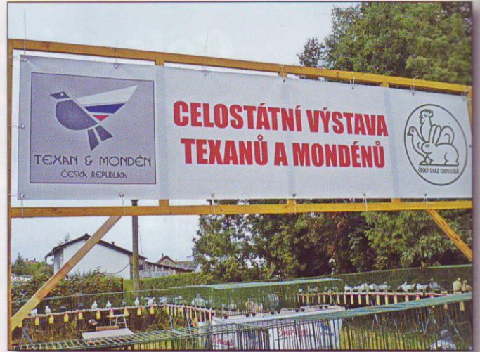
Poutač na celostátní výstavu