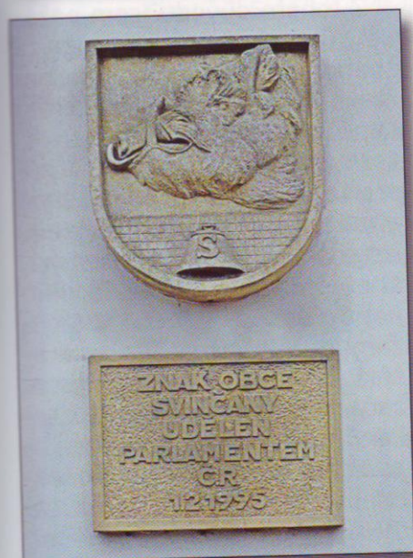
Znak obce Svinčany