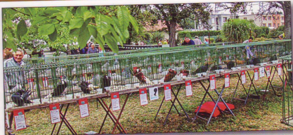
Pohled na expozici holubů, králíků a drůbeže