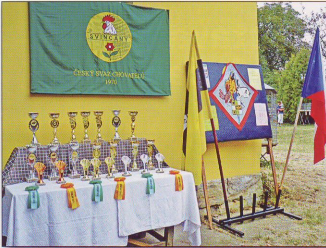
Připravené poháry pro vítěze