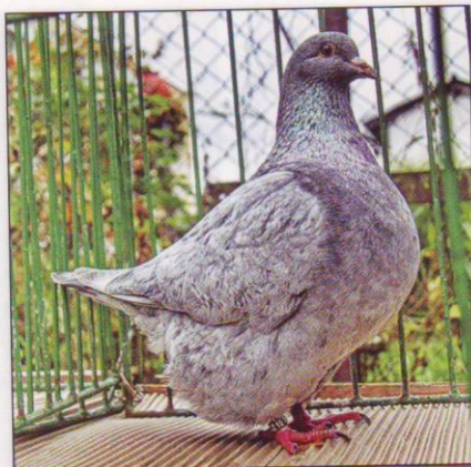
Texan chovatel: Lubomír Brňák