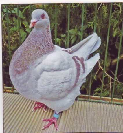
Texan chovatel: Lubomír Brňák