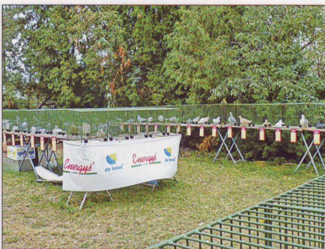
Expozice texanů a mondénů před otevřením výstavy