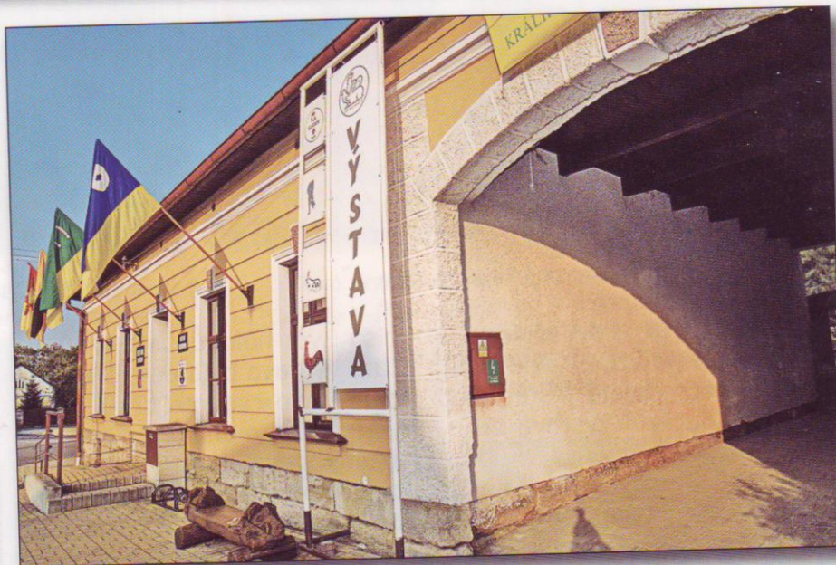
Vstup na výstavu