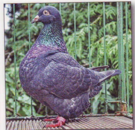
Texan chovatel: Lubomír Brňák