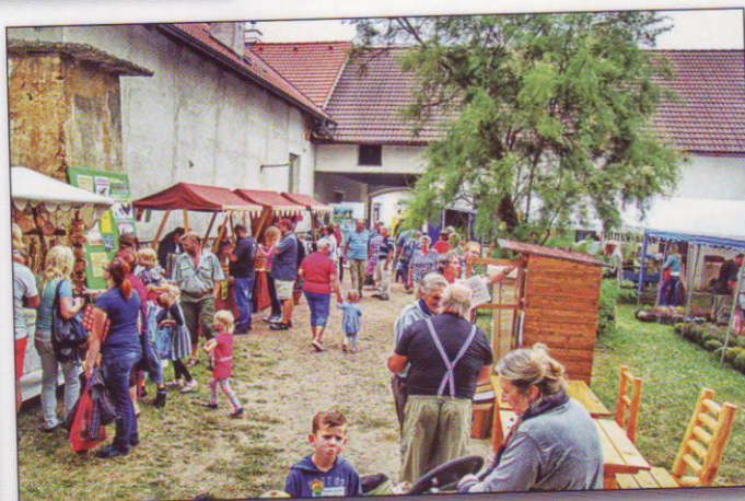
Prodejní stánky byly umístěny nejen před areálem, ale i v areálu výstaviště